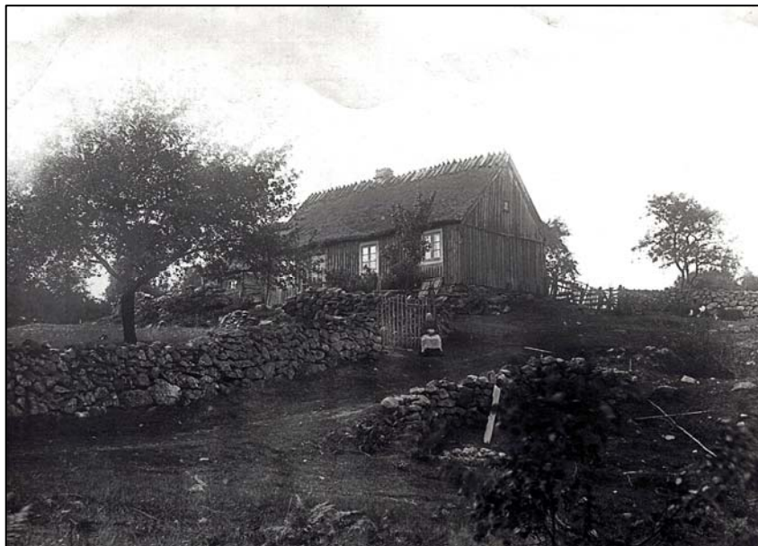
Starkatorpet i Vånga socken, Skåne. Fotografi från 1920-talet.

Kulturväxter och torplämningar – inventeringskurser