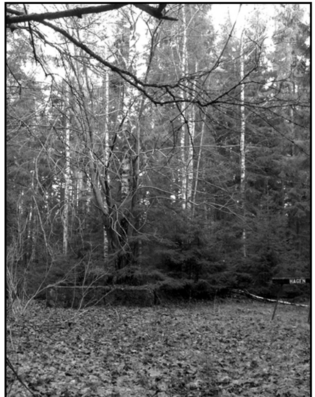
Vad finns kvar i dag?