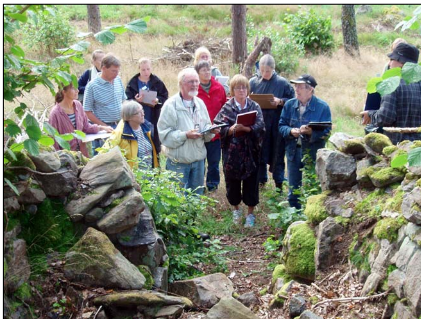
Vad finns kvar i dag?